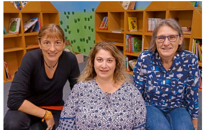
Die Mitarbeiterinnen der Bücherei

In der Grundschule (Eingang in der Schulstraße) ist die Gemeindebücherei seit mehr als 40 Jahren untergebracht. Etwa 8000 Medien werden zur kostenlosen Ausleihe für alle Altersgruppen angeboten: Bilderbücher, Geschichtenbücher, Romane, Krimis, Historisches, Sachliteratur, Hörbücher und Musik-CDs für Kinder sowie DVDs für alle Altersgruppen. Außerdem steht den Besuchern ein öffentlicher Internet-Zugang kostenlos zur Verfügung. Das Medien-Angebot kann erweitert werden durch die Kreisergänzungsbücherei und die elektronischen Medien aus der Online-Bibliothek Ludwigsburg. In Zusammenarbeit mit den Kindergärten und der Grundschule finden diverse Veranstaltungen, z. B. Autorenlesungen oder Vorlesen durch die Mitarbeiterinnen statt. Jeden ersten offenen Mittwoch im Monat gibt es Bilderbuchkino für 3- bis 6-Jährige. Im „Literaturkreis“ sprechen Erwachsene jeden 2. Freitag im Monat über ein Buch ihrer Wahl. Aktuelles ist auf der Homepage zu finden.