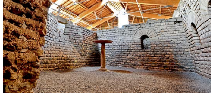
Römerhaus von innen

2010 Die Gemeinde feiert ihr zehnjähriges Partnerschaftsjubiläum mit den französischen Gemeinden des Verwaltungsverbandes des Grees und nimmt freundschaftliche Beziehungen zu der kroatischen Gemeinde Barban auf.