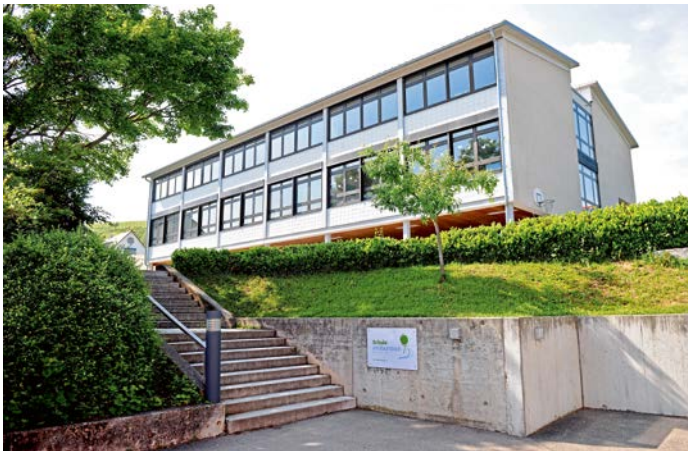
Schule am Baumbach

Zur Schule gehören ein weiträumiger Schulhof mit Grünanlagen und ein Schulgarten. Der „Altbau“ wurde 1951/52 errichtet. Dort ist auch die Gemeindebücherei der Gemeinde Walheim zu finden. Eine Erweiterung erfolgte 1964 durch den „Neubau“. Seit 1971 ist die Schule eine reine Grundschule. Alle Schülerinnen und Schüler besuchen ab der 5. Klasse die weiterführenden Schulen in und um Besigheim.