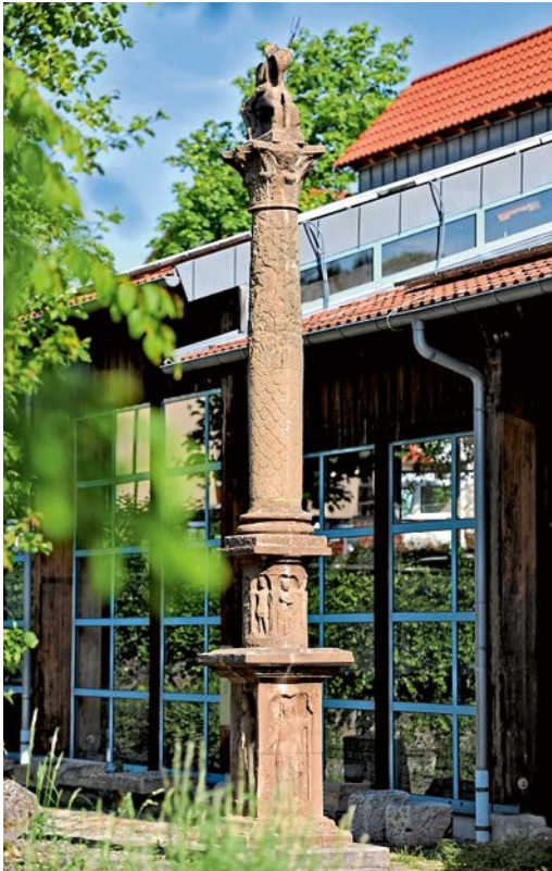
Jupitersäule vor dem Römerhaus

Mit 15 Euro Mitgliedsbeitrag pro Jahr (Jugendliche 5 Euro) können Sie die Arbeit des Vereins unterstützen.