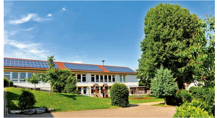
Schule am Baumbach

Neben der bereits gängigen Praxis der inneren und äußeren Differenzierung in offenen Unterrichtsformen in allen Jahrgangsstufen hat sich die Grundschule Walheim bereits 2007 auf den Weg zur jahrgangsgemischten Eingangsstufe gemacht. So arbeiten wir in der dreizügigen jahrgangsgemischten Eingangsstufe nach dem Lernstraßenprinzip. Hierdurch kann jedes Kind in seinem individuellen Lerntempo lernen und individuell unterstützt werden.