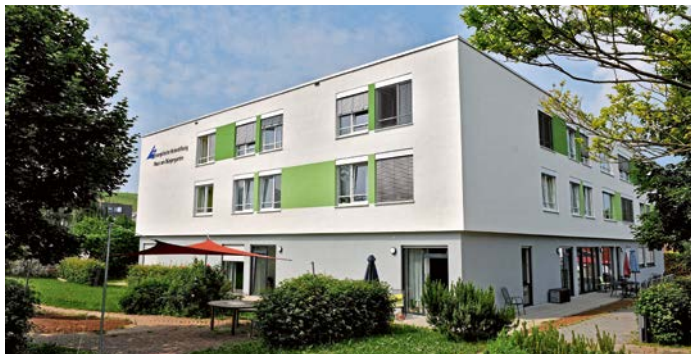
Pflegeheim „Haus am Bürgergarten“

Für Fragen zu unserem Pflegeheim wenden Sie sich direkt an das Haus am Bürgergarten, Telefon 40296-0