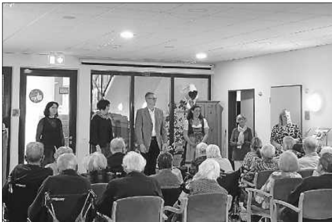
Danke für den Nachmittag!