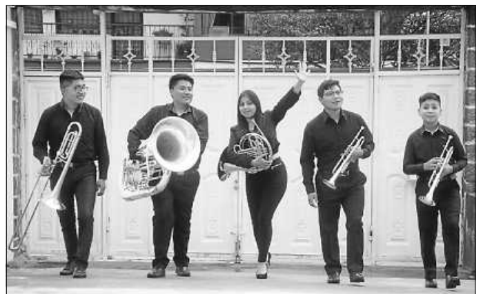
Mit südamerikanischen Melodien sind die Musiker der Ecuador Brass Band in Gemmrigheim zu hören.

25 Konzerte werden die jugendlichen Musiker in der Schweiz und Deutschland spielen. Neben Konzerten u. a. in Luzern, Bad Tölz und Stuttgart steht auch Gemmrigheim auf dem Tourneepplan. Im Rahmen der Open-Air-Kinonacht am Freitag, den 28. Juli, wird das Ecuador Brass Ensemble ab 20.00 Uhr auf dem Kelter-Vorplatz in Gemmrigheim eine Stunde für die Besucher musizieren. Freuen darf man sich auf ein abwechslungsreiches Konzert, das neben Klassikern von Händel auch südamerikanische Melodien zu bieten hat. Die Musiker werden mit zwei Melodien aus Kuba eine wunderbare Überleitung zu dem Film der Open-Air-Kinonacht bieten.