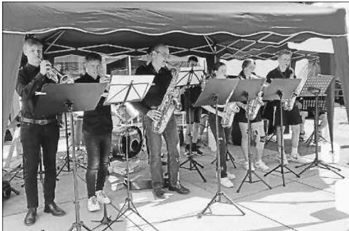
Die Big Band der Musikschule Besigheim - hier bei einem Auftritt beim Steinhaus-Fest