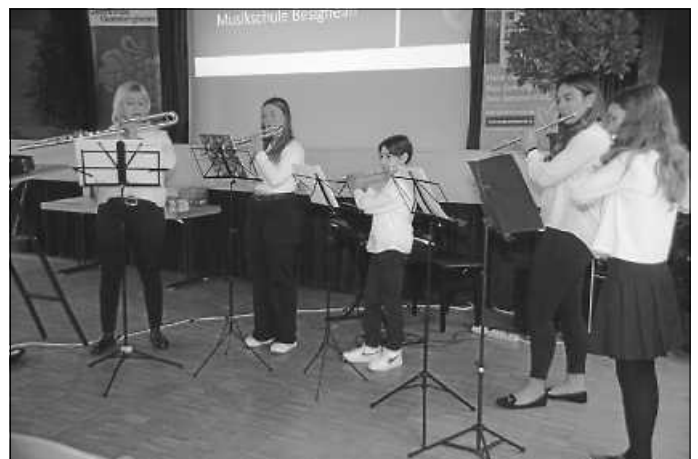
Beim Neujahrsempfang der Gemeinde dabei: das Querflöten-Ensemble

Dabei erhielten sie viel Applaus für ihre Darbietungen. Während sich die Querflöten zeitgenössische Literatur von Andre Waignein und Pascal Proust widmeten, trugen das Duo Klarinette und Klavier ein Menuett sowie eine Gloriette vor.