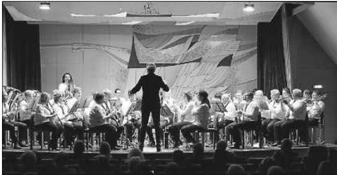
Das Steinhaus-Orchester wirkt im zweiten Teil des Konzertes mit und begleitet die Chöre beim deutsch-chinesischem Finale