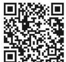
QR-Code: F. Wulle

Wer auf privatem Weg die aktuellsten Infos der Kirchengemeinde erhalten möchte, kann sich über diesen QR-Code in den WhatsApp-Kanal eintragen!