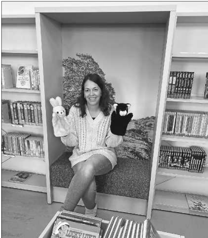
Handpuppen Hase und Katze

Wir konnten der Gruppe außerdem ein kleines Geschenk mitgeben: zwei Handpuppen – ein Hase und eine Katze. Der Hase hatte gleich Einsatz beim gemeinsam gesungenen Fingerspiel „Klein Häslein wollt spazieren gehn“. Wir wünschen den Kindern und Mitarbeiterinnen viel Freude mit Hase und Katze und freuen uns auf weitere Besuche bei uns in der Bücherei!