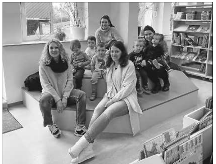
auf der grünen Treppe

Letzte Woche hatten wir in der Bücherei einen netten Überraschungsbesuch: Eine Gruppe der Kinderkrippe hatte sich von den Containern aus „den Berg hoch“ in die Bücherei gemacht. Sie erkundeten neugierig die Bücherregale und -kästen. Interessant war natürlich auch die Treppe, auf der man sitzen kann.