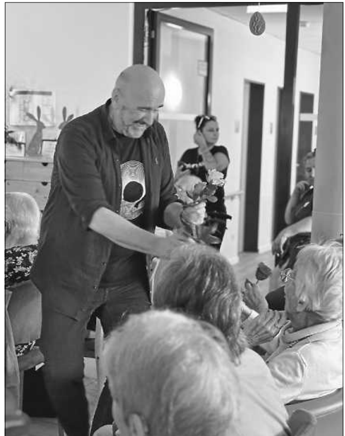
Rote Rosen, rote Rosen ...