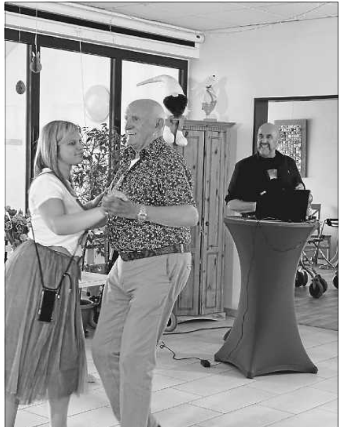
Ein Tänzchen in Ehren ...

Weitere Informationen folgen, wenn alle rechtlichen Schritte abgeschlossen sind, im Amtsblatt oder über die Website der Schule am Baumbach.