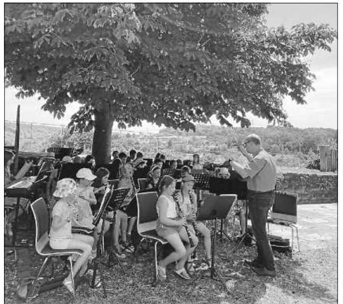
Viel Musik im Steinhaus und im Garten gibt es beim Tag der offenen Tür der Musikschule Besigheim

Die Musikschule Besigheim und die Stadtkapelle feiern gemeinsam am 16. Juni 2024 das Steinhaus-Fest. Dabei wird der Steinhaus-Garten durch die Stadtkapelle bewirtschaftet und für das leibliche Wohl ist bestens gesorgt. Die Musikschule präsentiert sich mit einem Tag der offenen Tür. Von 9:45 bis 17:00 Uhr ist Musik im Steinhaus-Garten und im Kleinen Saal geboten. Mit Vorspielen, offenem Unterricht, Begegnungen und besonderen Darbietungen kann das Unterrichtsangebot der Musikschule Besigheim erkundet werden. Mit einem umfangreichen Programm stellen sich die Lehrkräfte und natürlich auch Schülerinnen und Schüler aus den einzelnen Unterrichtsklassen vor. Man kann zuhören, die Musik genießen oder sich für das Lernen eines Instrumentes inspirieren lassen. Es besteht auch die Möglichkeit, gleich vor Ort Fragen an die Lehrkräfte zu stellen. Um die Planung etwas zu erleichtern, bitten wir um Anmeldung über das Sekretariat, falls ein Instrument gleich ausprobiert werden soll unter Telefon 07143 407890 oder musikschule@besigheim.de