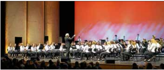
Das Kreisjugend-Orchester im Ludwigsburger Forum am Schlosspark.